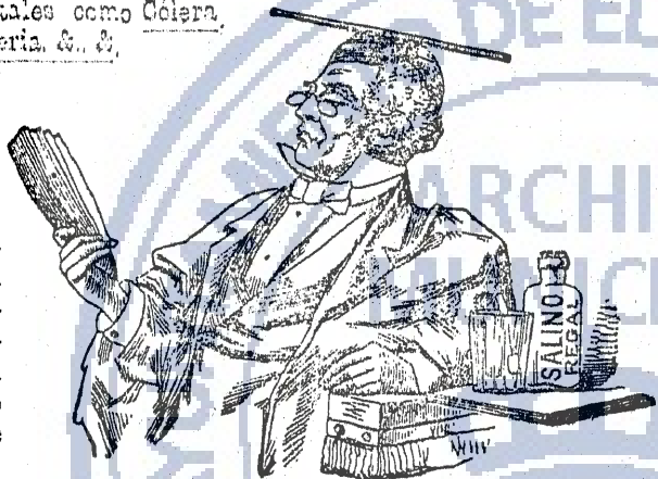
Cartas desde SEIS reales el ciento. Larga, 116

Bebida agradable, ligeramente laxante y NO IRRITA. Regula las funciones del sistema en general, y lo fortalece. Cura positivamente todas las afecciones del estómago y del vientre. En su efervescencia desarrolla el OZONO, que es el principio de la vida. Sus cualidades antisépticas preservan, al que lo toma, de las enfermedades infecciosas, impidiendo en el cuerpo humano, el desarrollo de los microbios ó micro-organismos que producen el mal.